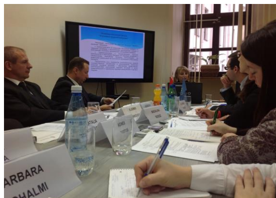
ПП2 экспертная миссия в Республику Беларусь 2013