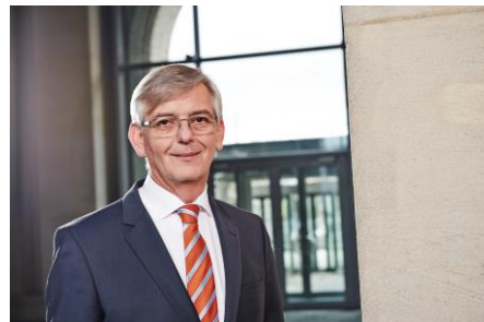
Д-р Манфред Шмидт, Президент Федерального ведомства по миграции и беженцам

Сегодня Федеральное ведомство насчитывает 22 офиса и около 2,000 сотрудников. В связи с текущим увеличением ходатайств о предоставлении убежища будут открыты новые офисы и наняты новые сотрудники для реагирования на вновь формирующиеся потребности. Благодаря своей общенациональной сети Федеральное ведомство тесно сотрудничает с общественными организациями и институтами, как национальными, так и международными, вовлеченными в сферу защиты беженцев и вопросы интеграции мигрантов, имея, по крайней мере, один филиал в каждой из 16-ти федеральных земель.