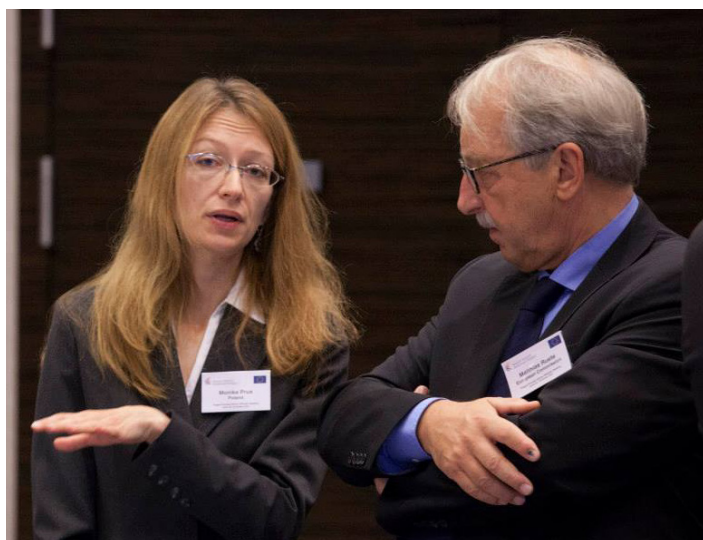
Г-жа Моника Прус, Директор Департамента миграционной политики, Министерство внутренних дел Республики Польша (слева), г-н Маттиас Рюте, Генеральный директор DG HOME (Генеральный директорат по внутренним делам), Европейская Комиссия (справа).

В конце октября прошлого года я был приглашен принять участие во Встрече Старших должностных лиц в Берлине. Будучи новичком в этой области политики, я спросил у коллег, в чем суть данного Процесса? Что делает его актуальным для наших политических и оперативных приоритетов? И какие новшества он вносит в существующие комплексные реалии?