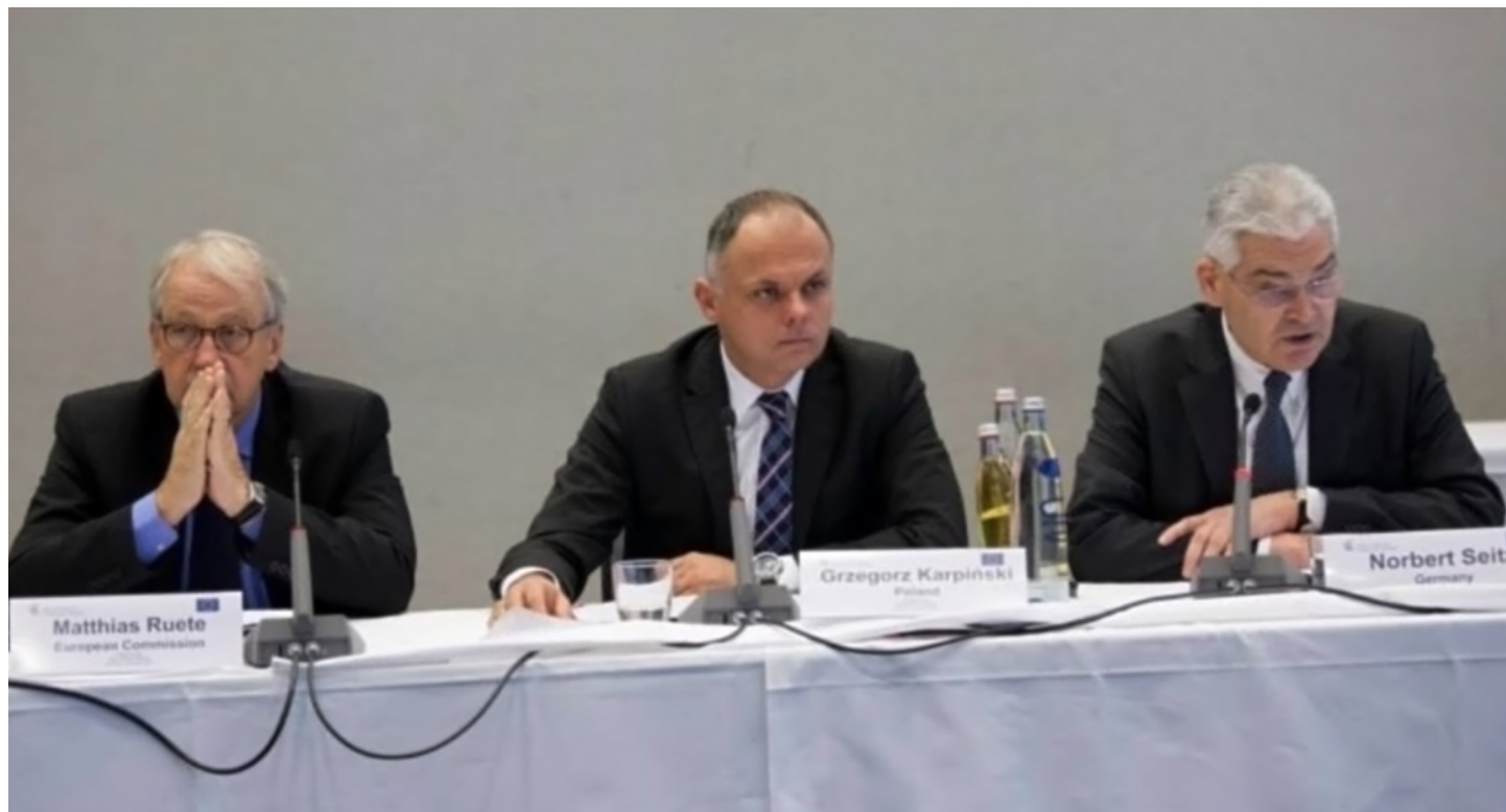
Г-н Маттиас Рюте, Генеральный директор DG HOME (Генеральный директорат по внутренним делам), Европейская Комиссия (слева), г-н Гжегож Карпинский, Заместитель государственного министра внутренних дел Республики Польша (в центре), г-н Норберт Сайц, Генеральный директор Департамента по вопросам миграции, интеграции, беженцев и европейской гармонизации Министерства внутренних дел Федеративной Республики Германии (справа).

В моем понимании, сотрудничество в рамках Пражского процесса также помогает установить связь для ежедневного сотрудничества экспертов в области миграции из Восточных и Юго-Восточных государств. Зачастую, такое сотрудничество более актуально, чем формальные соглашения.