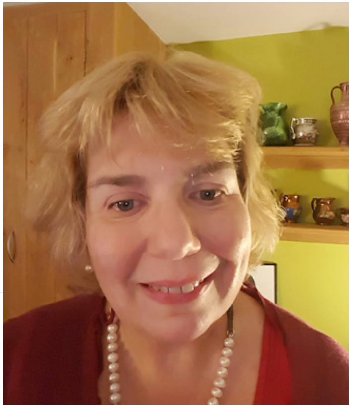
Г-жа Джудит Глисон Судья Высшего Суда Великобритания

Да, повлияло. В последние годы количество заявлений о предоставлении убежища в Великобритании сокращается, преимущественно вследствие менее либерального национального подхода к поддержке соискателей убежища, однако в этом году мы ожидаем резкий всплеск вследствие интенсивной миграции в Европе. Деятельность нашей ускоренной системы, рассматривающей дела задержанных заявителей из безопасных стран происхождения, была приостановлена апелляционным судом, поскольку было посчитано, что временные рамки слишком короткие. Как и во всех международных судебных системах, существует давление по поводу скорейшего принятия решений, чтобы быстро вернуть соискателей убежища, которым было отказано, в их страны происхождения или дублинские пункты въезда в еврозону. Значительная часть судебных пересмотров касается решений о возвращении соискателя для рассмотрения его дела в стране прибытия в Европейский Союз в соответствии с Дублинским регламентом.