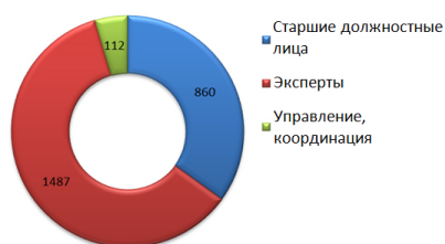
Участники / Целевые группы (в среднем, вкл. 2016 г.)