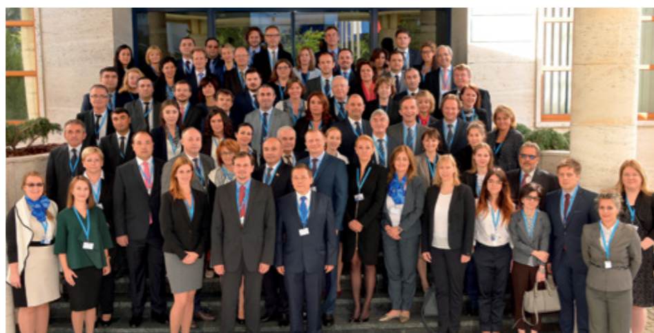
Встреча Старших должностных лиц Пражского процесса 19 сентября 2016 года, Братислава, Словакия

После краткого введения в историю и основные этапы подготовки документа, все государства-участники были приглашены представить свои заключительные замечания и предложения, которые в дальнейшем нашли свое отражение в тексте Декларации.