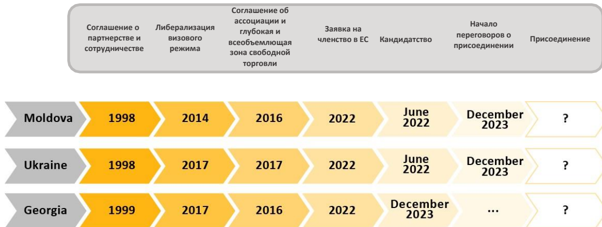
Схема 1: Ключевые вехи приближения Грузии, Молдовы и Украины к ЕС