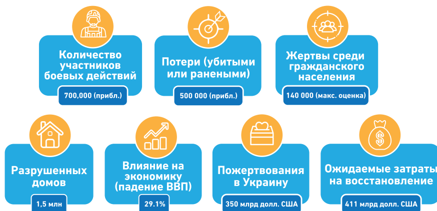
Рис. 1: Некоторые ключевые данные о войне (все к середине-концу 2023 г.)

Экономика пережила значительный спад: сокращение составило 29,1% в 2022 г. (МВФ), но в 2023 г. она восстановилась до +2%, отчасти благодаря притоку значительных средств от доноров Украины. К маю 2022 г. война привела к потере от 4,8 млн (МОТ) до 6,4 млн (ZOIS) рабочих мест, но около трети этих рабочих мест могли быть восстановлены к лету 2023 г. Хотя некоторая нормальность (The Conversation) вернулась во многие регионы Украины, внутри страны 17,6 млн украинцев нуждаются в гуманитарной помощи (УВКБ ООН). Доноры предоставили Украине 350 млрд долларов, де-факто субсидируя государство, экономику и общество (Conflict Tracker). Дополнительные ожидаемые затраты на послевоенное восстановление оцениваются в 411 млрд долларов (Всемирный банк).